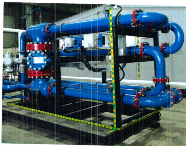
Рисунок 1 – Общий вид ТПУ

ТПУ являются однонаправленными и имеют стационарное и передвижное исполнения. Общий вид ТПУ приведен на рисунке 1.