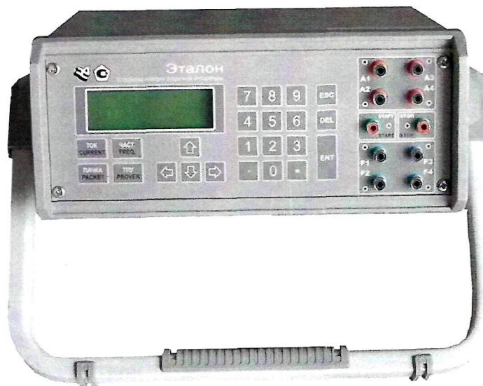
Рисунок 1 - Общий вид устройств поверки вторичной аппаратуры «УПВА-Эталон»

Общий вид устройств поверки вторичной аппаратуры «УПВА-Эталон» представлен на рисунке 1.