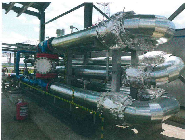
Рисунок 1 – Общий вид установок трубопоршневых «НАФТА-ПРУВЕР»-300

Общий вид установок трубопоршневых «НАФТА-ПРУВЕР»-300 приведен на рисунке 1.