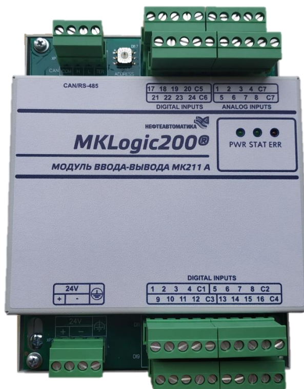
б) модуль ввода-вывода МК211 А