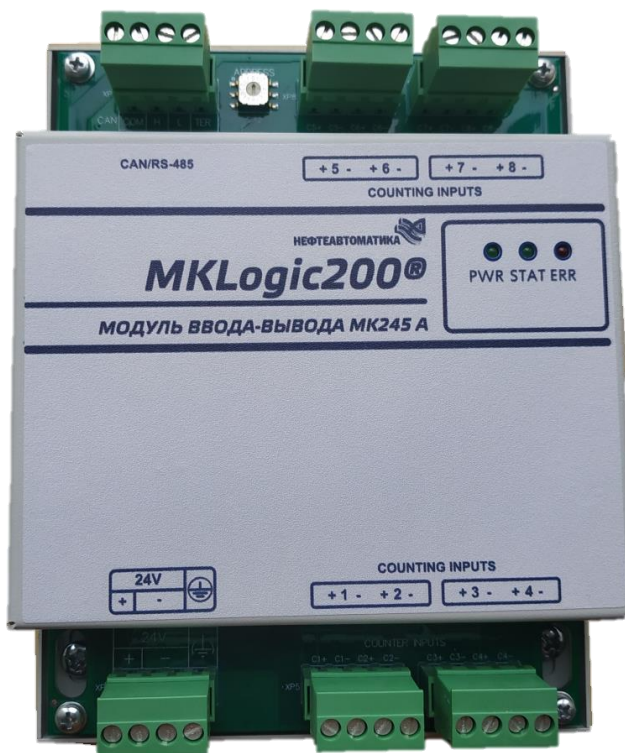
г) модуль ввода-вывода МК245 А