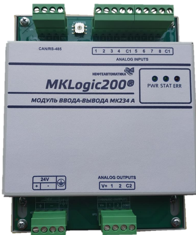
в) модуль ввода-вывода МК234 А